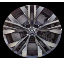
Легкосплавные диски «Ancona» 8 J x 17, стандартно для Alltrack