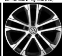
Легкосплавные диски «Singapore» Volkswagen R, 7 J x 17, опционально для Comfortline и Highline (PJ8)