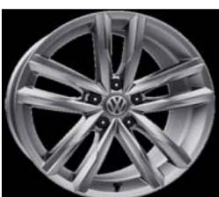
Легкосплавные диски «Dartford» 8 J x 18, серый металл, опционально для Highline (PJ6)