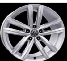
Легкосплавные диски «Dartford» 8 J x 18, серебристые, опционально для Highline (PJ7)