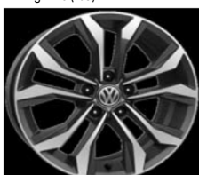
Легкосплавные диски «Soho» 7 J x 17, опционально для Comfortline и Highline (PJ5)