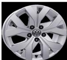
Легкосплавные диски «Moscow» 6.5 J x 16, стандартно для Trendline