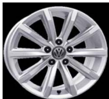
Легкосплавные диски «London» 7 J x 17, стандартно для Highline