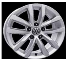
Легкосплавные диски «Serang» 6.5 J x 16, стандартно для Comfortline