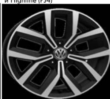
Легкосплавные диски «Nivelles» 7 J x 17, опционально для Comfortline и Highline (PJ4)