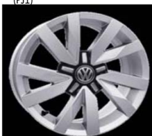
Легкосплавные диски «Aragon» 6.5 J x 16, опционально для Trendline (PJ1)